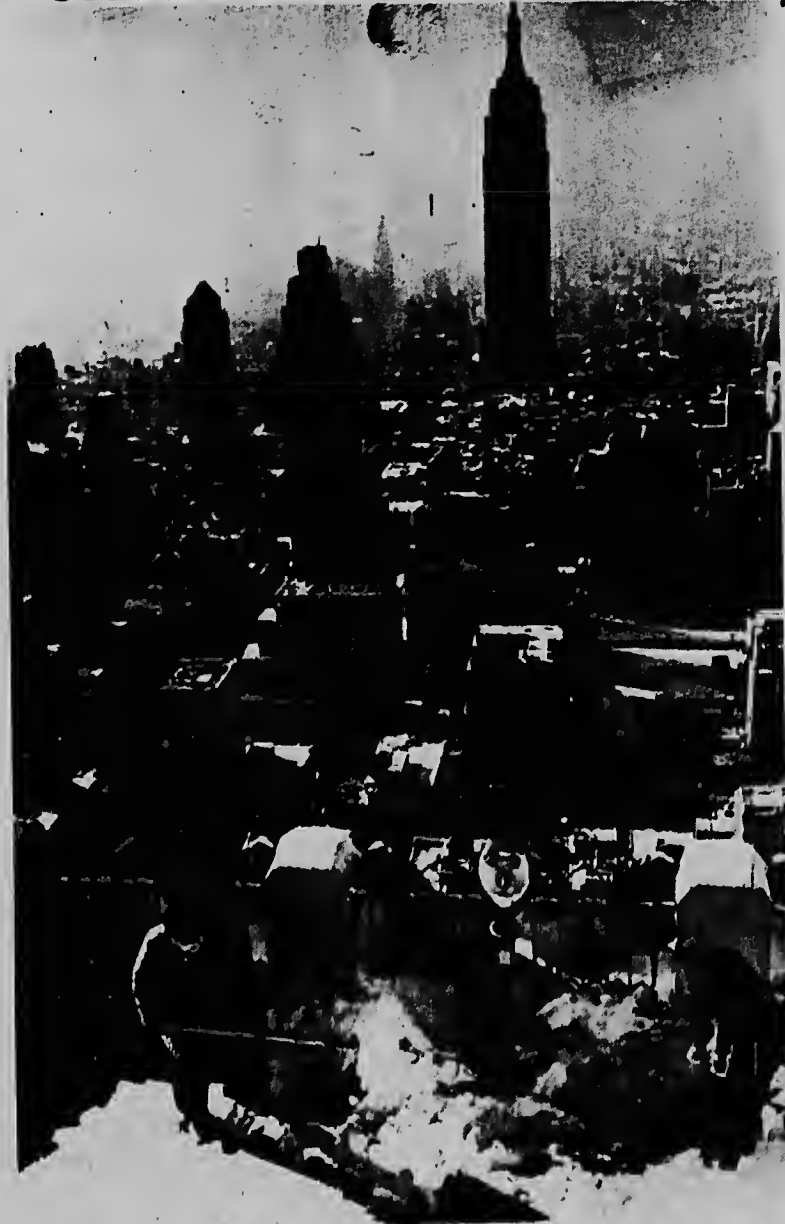
Te den top riba tur edificio di New York, trahadornan ta kitando e sneeuw for di e plateau di observacion di e edificio RCA. Net meimei di e foto por mira Empire State Building. Tur caminda tabatin sneeuw y mas sneeuw.